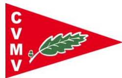
C. Velico Medio Verbano