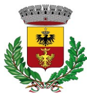
Comune di Laveno Mombello